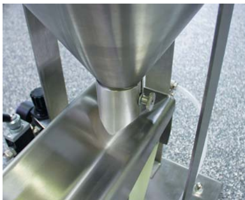
Dosierstützen am Behälterausruf